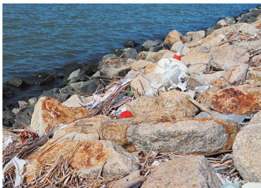
児島湖から流れついたゴミ状況

近年、混住化等の要因により、ペットボトルや空缶、肥料等のポリ袋、刈り取られた雑草等のゴミが不法投棄され、各地区の排水機場に大量に集まっています。さらに、タイヤや家電製品等の粗大ゴミも水路等に不法に投棄されており、それらが機場の設備を損傷させる原因の一つとなるだけでなく、用水や排水にも悪影響を及ぼします。これを改善するには、我々一人一人がゴミ投棄撲滅の意識を更に高めていくことが、最善の策と思われます。きれいな川と美しい児島湖を取り戻し、親しみのもてる水辺環境にしていきたいと思います。