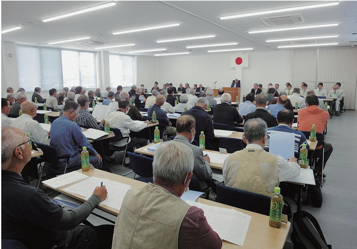
新事務所・新総代で迎えた総代会の様子（令和6年度第1回臨時総代会）