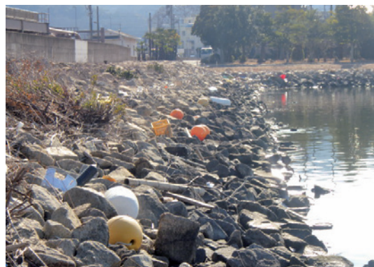
児島湖に流れついたゴミ状況

近年、混住化等の要因により、ペットボトルや空缶、肥料等のポリ袋、刈り取られた雑草等のゴミが不法投棄され、各地区の排水機場に大量に集まっています。さらに、タイヤや家電製品等の粗大ゴミも水路等に不法に投棄されており、それらが機場の設備を損傷させる原因の一つとなるだけでなく、用水や排水にも悪影響を及ぼします。これを改善するには、我々一人一人がゴミ投棄撲滅の意識を更に高めていくことが、最善の策と思われます。きれいな川と美しい児島湖を取り戻し、親しみのもてる水辺環境にしていきたいと思います。