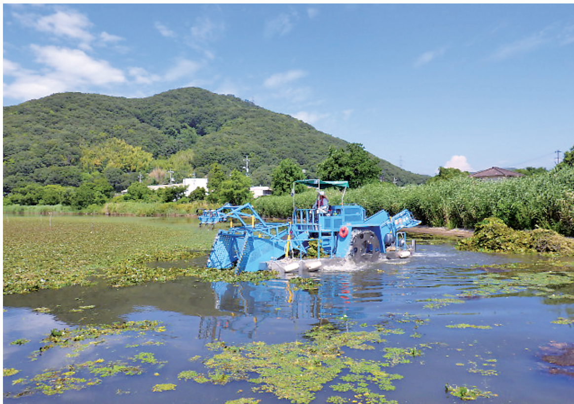
水生植物刈取船「淡水」による作業の様子

令和7年12月1日 児島湾土地改良区 岡山市南区築港緑町二丁目4番地29 ☎(086)262-0175