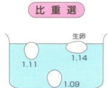
図 1 生卵による比重判定