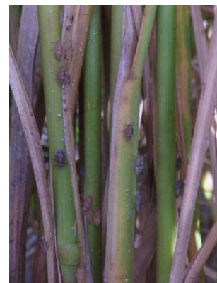
図8 トビイロウンカ