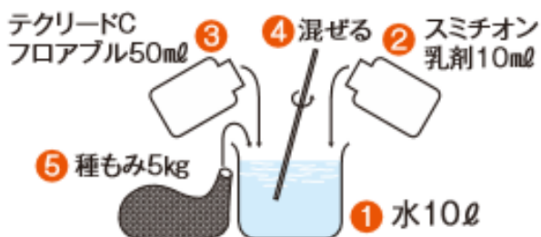
図 2 種子消毒の手順

水 10L にスミチオン乳剤 10ml、 テクリード C フロアブル 50ml を 溶かして、種籾を 24 時間浸漬 しましょう！