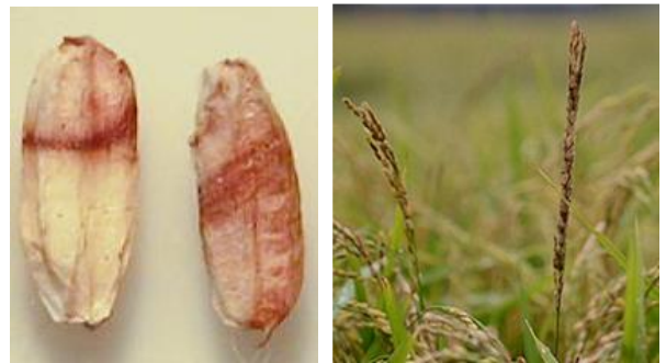
図3 罹病した玄米の症状(左)と穂の症状(右)